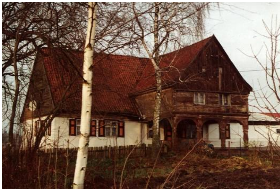
Dom podcieniowy w Kaniczkach z XVIII wieku.. (2000 r.)

poł. XIX w. W centralnym punkcie cmentarza został ustawiony żeliwny krzyż „Christine Gibbe, geb. Hermann”.