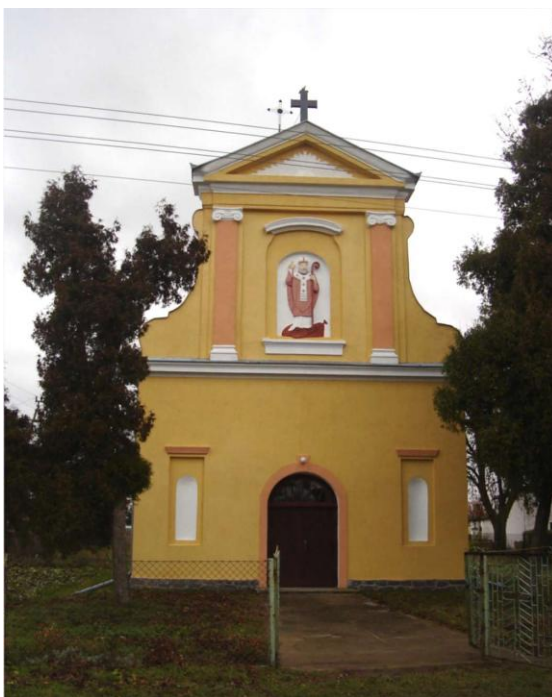
Kaplica Św. Wojciecha w Nebrowie Wielkim