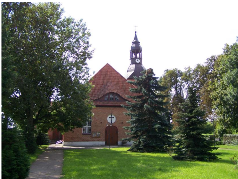
Kościół Parafialny p.w. Matki Boskiej Królowej Polski w Nebrowie Wielkim