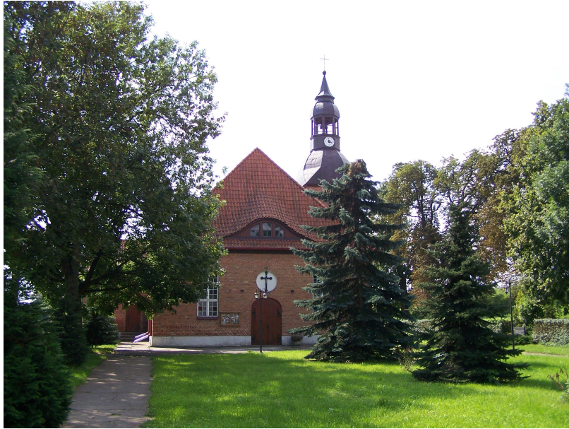
Kościół Parafialny p.w. Matki Boskiej Królowej Polski w Nebrowie Wielkim